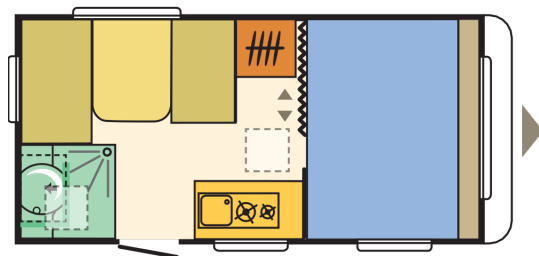
Aviva 400 PS